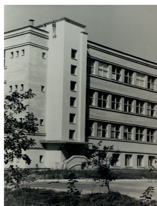
Pirmasis korpusas FTEPI miestelyje 1967 m.