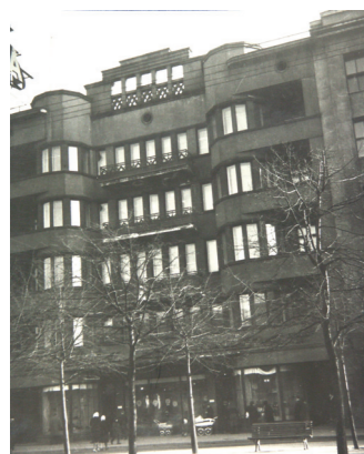
Instituto rūmai (Laisvės alėja 29) 1956-1972 m.

Svarbiausios instituto mokslinių tyrimų kryptys: šiluminė fizika ir hidrodinamika, mokslinio eksperimento automatizavimas, energetikos planavimas, aukštomis temperatūroms atsparių medžiagų savybių ir vandens ūkio problemų tyrimai.